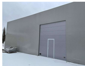
Fotod: Leevaku paadisild ja Santex laahoone.