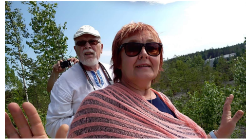
Fotod: karjäärisafaril Aidu karjääri ääres.