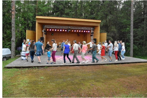
Fotod: Misso Avatud Noorteklubi MTÜ korraldatud Kariibi Kultuuri Festival ja Pullijärve jaanike.