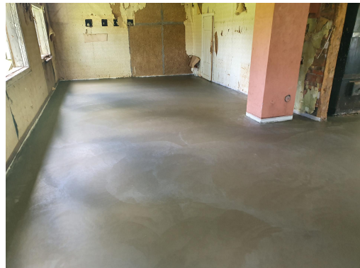
Fotod: Kirsi Talo Kodumajutuse OÜ renoveeritud laut-küün; Uusvada Kultuuriküla MTÜ renoveeritud Uusvada külakeskuse põrand.