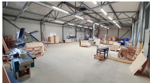
Fotod: SA Räpina Inkubatsioonikeskuse soetatud inventar Koiva majja; VIP-Mööbel OÜ laiendatud tootmishoone.