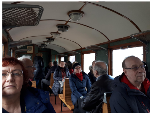
Fotod: Aluksne lossi vabaõhulava; sõit marsruudil Aluksne-Paparde.