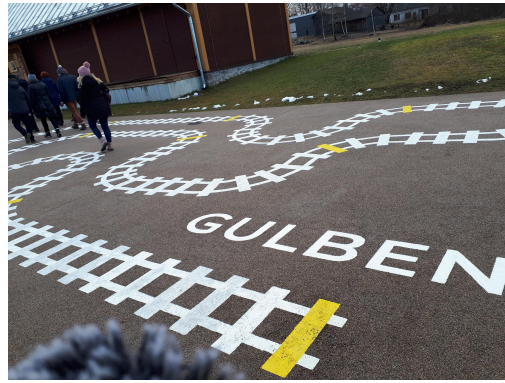
Fotod: "RADOŠO IDEJU CENTRS" loominguiliste ideede keskus, mis ühendab Eesti piirialal asuva Ape piirkonna inimesi, kutsub kohale lektoreid ja meistreid Lätist ja teistest maadest jagama Ape loomeinimestele oma teadmisi ja oskusi; Regioonide vaheline koostööprojekt 33 km Banitist pikkuses ja laiuses.