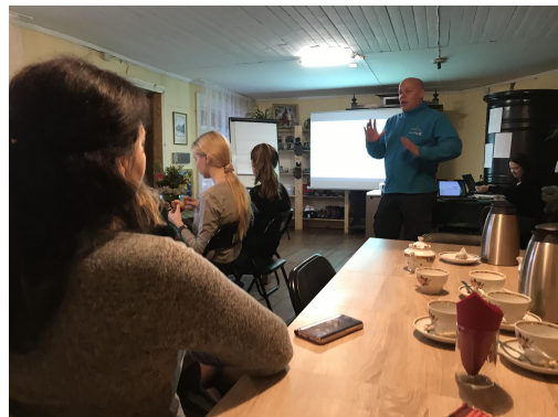
Fotod: piiriveere noored 9. jaanuari ühiskohtumisel Niitsiku kõrtsihoones.