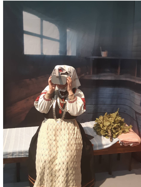
Fotod: Adeline Sunday OÜ soetatud Traveler's Friend lihatööstuse kuivatusahi; Setomaa Turism MTÜ tutvustab Setomaad läbi virtuaalreaalsuse.