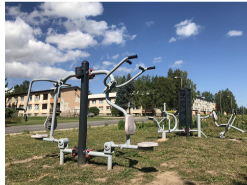
Fotod: SA Rápina Rápina Sadamad ja Puhkealad soetatud järvepääste paat; Spordiklubi MTÜ poolt Rápinasse rajatud väljõusaal.