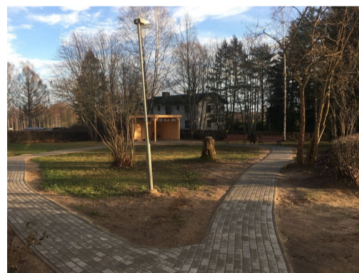
Fotod: Toosikatsi OÜ fermenteerimismahutite saabumine Sloveeniast; Väraska Súdamekodu OÜ rajatud lehtla ja jalgteed.

Kõikide ellu viidud projektidega on võimalik tutvuda siin .