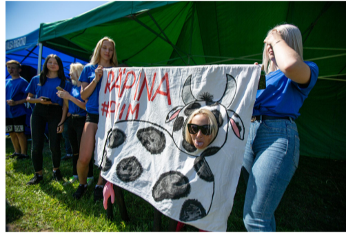
Fotod: Vārska ja Meremāe rühmade ühine jalgpallimatš Meremāe kooli staadionil; Rāpina malevarühm esitleb Piiriveere ja Tankla malevarühmade kokkutulekul oma rühma lippu, mis sai rühmade arvestuses esikoha.

MTÜ Piiriveere Liider tänab tööandjaid, kes olid valmis piirkonna noortele tööd pakkuma: Lōuna-Antsu talu OÜ, AS Plantex, OÜ Almar Puit, Setomaa vald, SA Piusa ja OÜ Mentli .