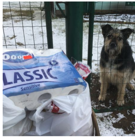
Fotod: ükselt ukse teenus eriolukorra tingimustes.