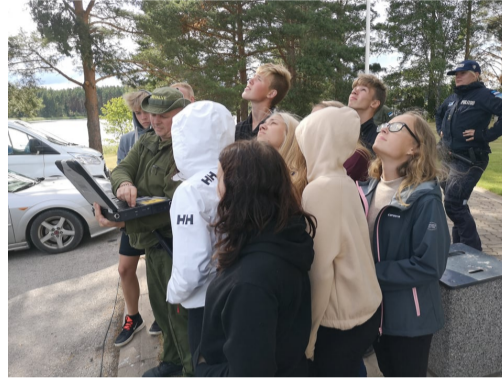
Fotod: Meremāe rühma inimsõna MALEV; Vārska rühm külastamas Vārska piirivalve kordonit.

Kahe nädala sisse mahtusid erinevad vaba aja tegevused ja ka Piiriveere ja Tankla õpilasmaleva rühmade kokkutulek Valgamaal Kuutsemāel, kus toimusid erinevad rühmade vahelised võistlused, milleks valmistumiseks anti esimesel malevanädalal kõikidele rühmadele kodus ülesanded.