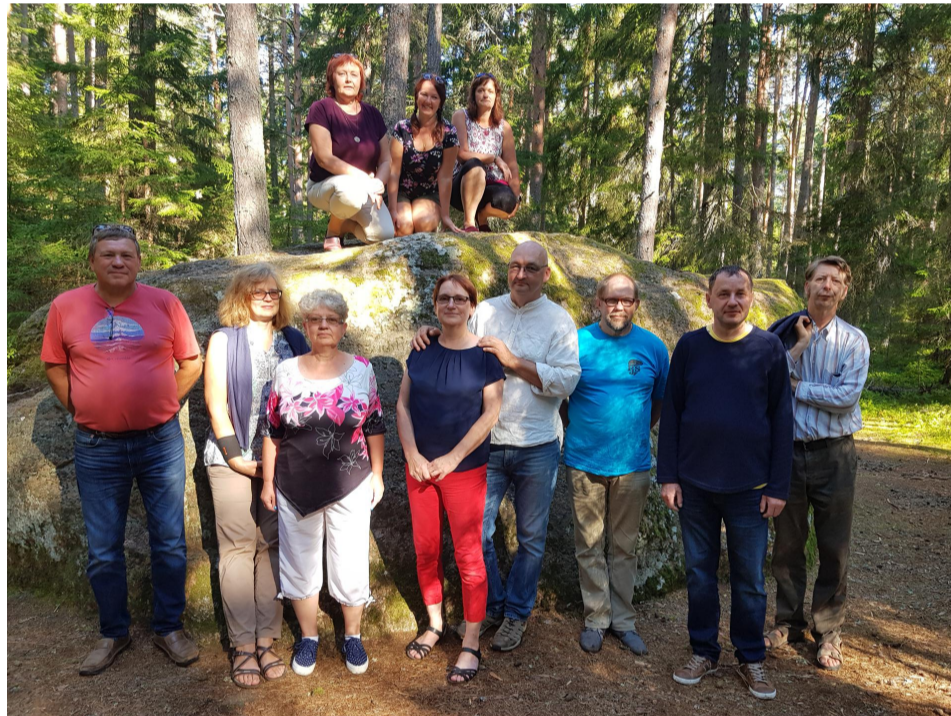
Foto: piiriveerlased Vormsil vaimsust värskendamas.

Piiriveere Liider korraldas oma liikmetele 7.-8. augustil õppereisi Eesti suuruselt neljandale saarele - Vormsile. Õppereisil tutvuti saare vaatamisväärsuste ja LEADER toetusel ellu viidud projektidega, teiste seas külastati nt Rälby külamaja, Hullo küla käsitöötuba ja Pears'i talumuuseumi, kohtuti Sarapuu puhkemaja, lihaväisekasvatusega tegeleva Vormsi MT OÜ ning Fällerna küla metsandusettevõtte esindajatega.