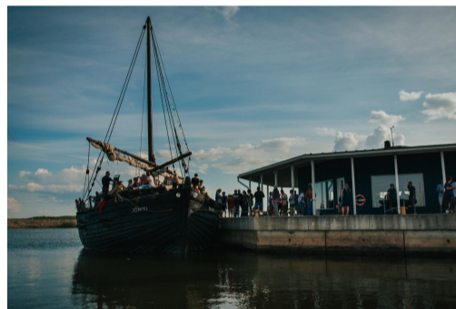
Fotod: 17. juulil mõlasurf Värskas ja lodi Jõmmu huvilisi sõidutamas 18. juulil Räpina sadamas.

Peipsi Järvefestivali korraldamist toetavad LEADER tegevusgrupid: Piiriveere Liider, Peipsi-Alutaguse Koostöökoda, Jõgevamaa Koostöökoda, Peipsi Kalanduspiirkonna Arendajate Kogu ja Tartumaa Arendusselts. Samuti PRIA Eesti maaelu arengukava 2014–2020 programmi ja Euroopa Maaelu Arengu Põllumajandusfondi vahenditest ning Euroopa Merendus- ja Kalandusfond.