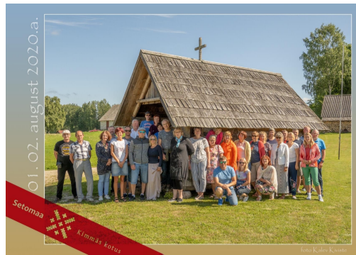
Fotod: külalised lõunapausil Inara Vanavalgõ Kohvitarõs, ühispilt Kuigõ tsässona juures.

Teist päeva alustati kõrgema vaate ja kaugema pilguga Meremäe vaatetornist . Nägemisulatusse jäid veel Miikse kirik ja surnuaed, Kiislova küla ning Põhjala Agro OÜ. Külalastati Kuigõ tsässonit, Lõuna-Antsu talu OÜ -d ja võeti linnupetet Kitsõ külätarõs . Vaata ka õppereisi galeriid .