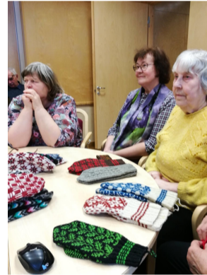
Fotod: 2017. a veebruarikuus toimus esimene kolmekümnest Seto rahvarõivaraamatu käsikirja teemapäevadest - kirikindad.