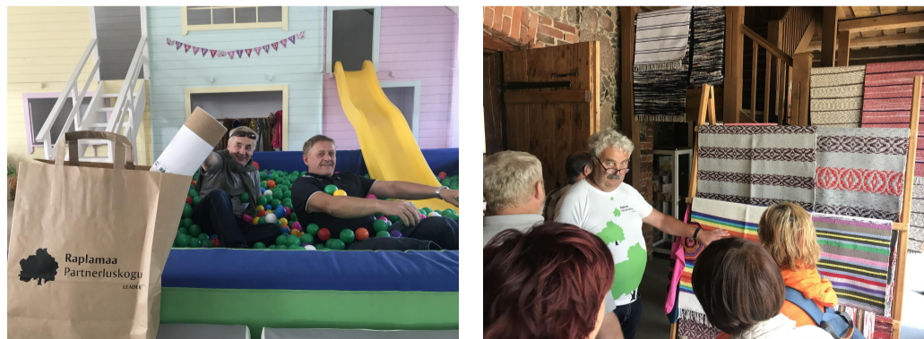
Fotod: külalised Prive mängumaad ja Räpina loomemaja avastamas.

Raplamaa Partnerluskogu Kai ja Juuru sidusrühmad külastasid 1.-2. augustil Piiriveere Liider tegevuspiirkonda. Õppereisi esimesel päeval külastati ettevõtet Santex OÜ , Räpina loomemaja , kaedi bussiaknast Räpina poldri hoiuala ning pandi jalg maha Räpina sadamas .