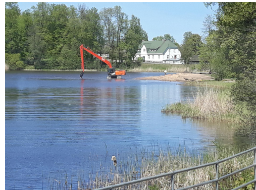
Fotod: Räpina Poldri Maaparandusühistu MTÜ parandas poldri pumbajaama välisilmet; Räpina Vallavalitsus korrastas paisjärve supluskoha.

Kokku on oma projektitaotluses kavandatud tegevused ellu viinud 92 taotlejat, nendest 6 lõplik väljamaksetaotlus on PRIA menetluses.