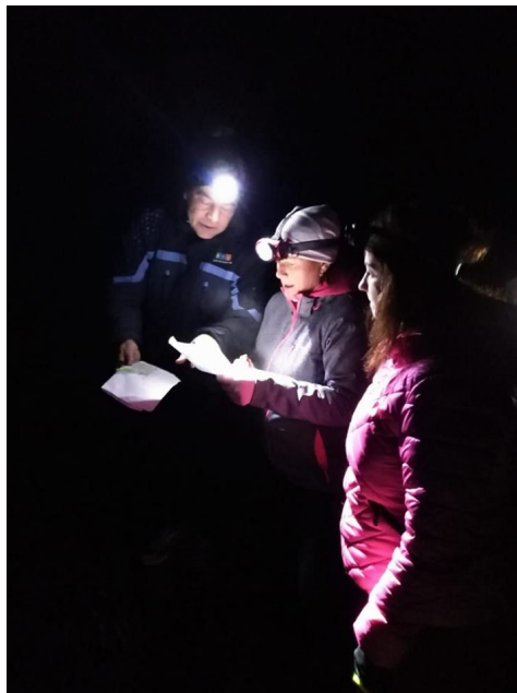
Fotod: Piiriveere Liideri orienteerumisseiklus Verhulisas.