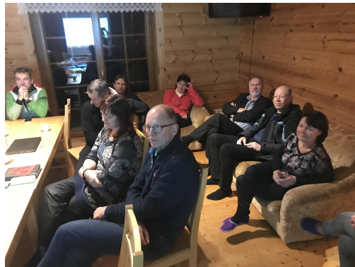
Fotod: Piiriveere Liideri üldkoosolek Peko puhkemajas.