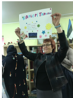
Fotod: külastamas endises Albu vallamajas tegutsevat Järva-Madise Külaseltsi ja Albu valla külade tuba Kaalepis.