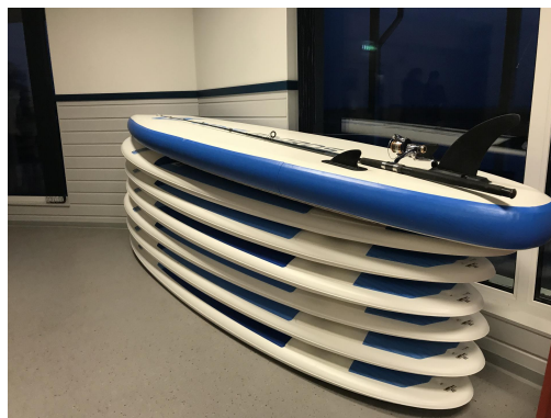
Fotod: reisiseltskond Rāpina loomemaja savi- ja klaasikojas, SA Rāpina Sadamad ja Puhkealad soetas LEADER-toetusega veesportdivahendeid.