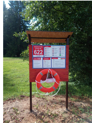
Fotod: Orava MTÜ paigaldas Niitsiku külamaja õhksoojuspumba, lisaks rajas hoonevälise kanalisatsiooni; Rõuge Vallavalitsus rajas Pullijärve äärde avaliku supluskoha.