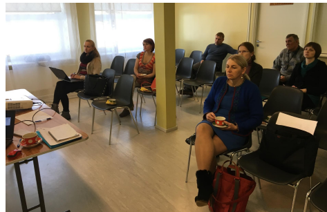
Fotod: PVL taotlejate infopäev Rāpinas (27.03) ja Obinitsas (28.03).

- 04. aprillil toimus endises Meremāe vallamajas PVL juhatuse koosolek , kus kiideti heaks koostööprojekti „Peipsimaa koostöövõrgustike tugevdamine (2018-2020)” esitamiseks üldkoosolekule kinnitamiseks.