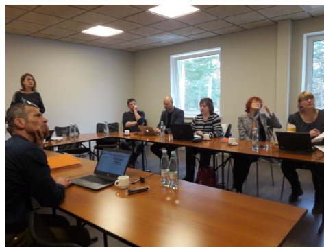
Fotod: PVL hindamiskomisjoni ja meetmenõustajate koolituspäev Vārskas (06.04).