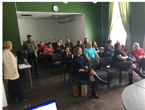
Fotod: PVL juhatuse koosolek ja üldkoosolek Meremāel (04.04).