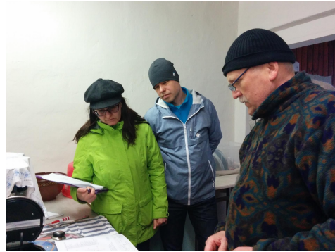
Fotod: PVL 2017 I voo hindamiskomisjoni liikmed 11.04.2017 külastamas projektitaotlejaid Orava Kultuur MTÜd ja Aig MTÜd.

Koostöö ja ühistegevuse arendamise meetmesse esitatud kaks projekti said mõlemad toetuse: kliimamuutuse ja säästva arengu teemaliste uute loodusõppeprogrammide väljatöötamine, koos loodusõppepäevade, -laagrite ja koolituste korraldamisega ning projekt „MissoFest“, mille raames korraldatakse erinevaid üritusi ja viiakse läbi koolitusi piirkonna organisatsioonidele.