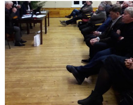
Fotod: PVL üldkoosolek Oraval (19.12).

19. detsembril 2017 kogunes Piiriveere Liideri üldkoosolek, et vastavalt hindamiskomisjoni ettepanekule projekti-taotlused kinnitada või kinnitamata jätta. 09. jaanuar 2018 juhatuse otsusega kinnitati ettevõtluse arendamise meetme (meede 2) osas parandustega paremus-järjestuse ettepanek. Kuna rakenduskava meetmete eelarve oli piiratud, said esitatud 34 projektitaotlusest toetuse 18 taotlust kogusummas 246 090,21 eurot.