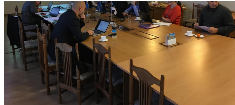
Fotod: taotlejate ärakuulamine Räpinas (12.11), hindamiskomisjoni koosolek Räpinas (30.11).

- 11. detsembril toimus Meremäe vallamajas PVL juhatuse koosolek , kus kooskõlastati PVL dokumendihalduskorra muudatused. Heaks kiideti järgmised muudatused esitamiseks üldkoosolekule kinnitamiseks: PVL strateegia üldmine hindamiskriteeriumite osas vastavalt strateegiarühma 13.09 esitatud ettepanekutele ning PVL põhikirja muutmine. Põhikirja muutmise vajadus tuleneb haldusterritoriaalse korralduse muutumisest ja LEADER määruse uuest redaktsioonist.