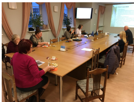
Fotod: üldkoosolek Obinitsas (29.09), juhatuse koosolek Rāpinas (03.11).

- 12. novembril toimus PVL 2017. a II taotlusvooru hindamiskomisjoni paikvaatlus ja ärakuulamine , kus oli esmakordselt antud kõikidele taotlejatele võimalus tutvustada oma projektitaotlust ja vastata hindamiskomisjoni liikmete küsimustele. Paikvaatlusel tutvuti 8 taotleja projektitaotlusega taotleja juures kohapeal. Paikvaatlusele järgnenud ärakuulamisest Rāpina loomemajas soovis osa võtta 23 taotlejat. Seega koguni 91% hindamisele edastatud projektitaotluste puhul said hindamiskomisjoni liikmed otse taotlejaga suhelda.