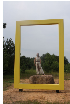
Fotod: vaade Räpina kollasest raamist Sillapää lossile ja pargile, Podmotsa külla püstitatud kollane raam.