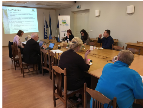
Fotod: juhatuse koosolek Meremäel (11.12) ja Räpinas (18.01).