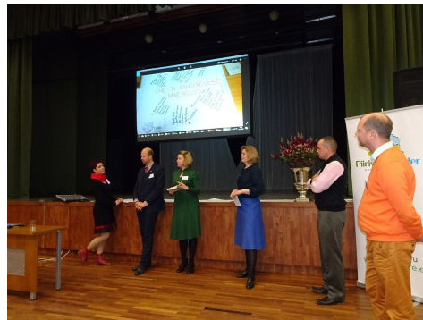
Fotod: arutelu töögruppides ja grupitöö tulemuste ettekandmine foorumil.