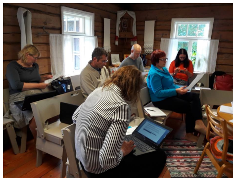
Fotod: Peipsimaa Koostööfoorumi meeskond õppekäigul Sardiinias (22.-28.09), hindamiskomisjoni ja meetmenõustajate õppepäev Obinitsas (29.09).

- 29. septembril pärast meetmenõustajate ja hindamiskomisjoni õppepäeva toimus Obinitsa külakeskuses PVL üldkoosolek , kus kinnitati PVL 2018. a tegevuskava, eelarve ja rakenduskava. Üldkoosolek kinnitas ka strateegia muutmise vastavalt juhatuse 09.08 otsusele lubada ühistegevuse arendamise meetmes (meede 3.1) investeeringu kuni 20% abikõlblikest kuludest. PVL esitab vastava muudatuse Maaeluministeriumile kinnitamiseks prognoositult veebruarikuus.