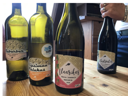
Fotod: Külalised Prive Vaba Aja Keskuse jõusaalis; Räpina loomemajas degustreeriti maja pruulikojaga veine.