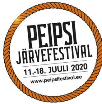
Fotod: Peipsi Järvefestival Võrkas; tänavuse festivali logo.

Peipsi Järvefestival toimus sel suvel juba viiendat korda. 11.-18. juulini sai erinevates Peipsimaa sadamates tutvuda kohaliku eluoluga, proovida kohalikke maitseid ja laevutada Peipsi järvel. Külalised said osaleda töötubades, mis tutvustasid nii toidu valmistamist kui Peipsi järvega seotud tegevusi. Öhtuid lõpetas kontsert Peipsi kaldal.