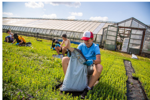
Fotod: Piiriveere õpilasmaleva logo töötas välja Maivart Studio OÜ; Rāpina malevarühm rohimas isitkuid AS Plantex Rāpina aiandis.

Õpilasmalevat korraldati LEADERi koostööprojekti „ Õpilasmalev Valgamaa ja Piiriveere Liideri piirkonnas “ raames ja seda toetas PRIA Eesti maaelu arengukava 2014–2020 programmi ja Euroopa Maaelu Arengu Põllumajandusfondi vahenditest.