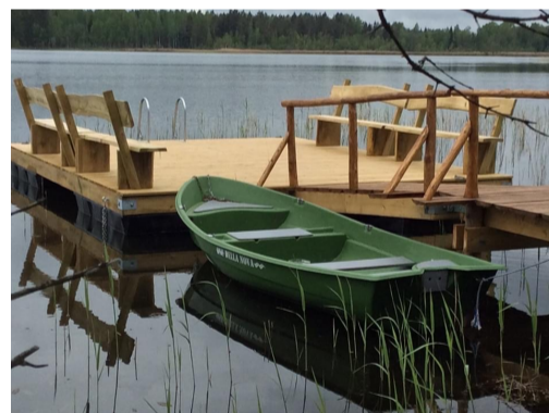
Fotod: Röpina seiklusrada; Hino järve ujumis- ja paadisild.