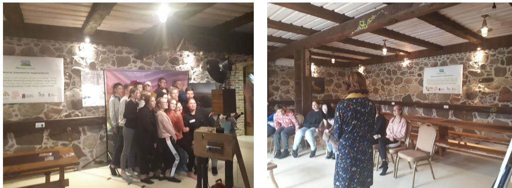
Fotod: 24.-25. oktoobril arutleti noorte kaasamise tegevuskava üle.

Möödunud nädalavahetuse veetsid Piiriveere noored Päikseranna puhkemajas arutledes noorte kaasamise tegevuskava üle . Oli hea võimalus kohtuda teiste noortega, kuulda nende huvitavatest tegemistest ja mõtetest ning teha meeskonnatööd. Sündmusel sai fotoboksis teha sõpradega lõbusaid fotosid. Salapärasest põnevust pakkusid Kõvera küla õised metsad, kui eevil seltskond asus pimedas hilisõhtusele matk-orienteerumisele.