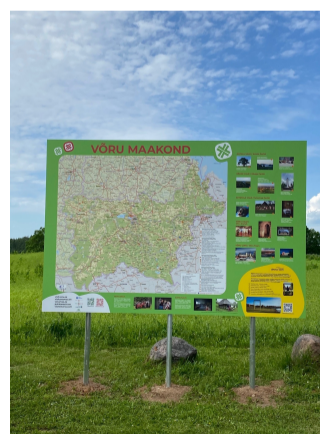
Fotod: Välikaardid Koidula piiripunkti ja Meremäe vaatetorni juures.

Kõikide ellu viidud projektidega on võimalik tutvuda siin .