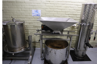
Fotod: Setomaa Vallavalitsuse parendatud Obinitsa lipuväljak; Vaslamäe Mahe OÜ soetatud mahla töötlemise ja villimise seadmed.

Kokku on oma projektitaotluses kavandatud tegevused ellu viinud 101 taotlejat, nendest 3 lõplik väljamaksetaotlus on PRIA menetluses.