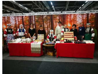
Fotod: Seto Käsitüü Kogo MTÜ korraldatud piirkonna käsitöölise reis Muhumaale ja välismessi külastus Rootsis.